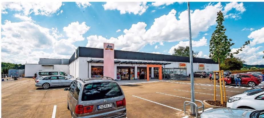
In der Gemeinde Perl gibt es bereits zwei dm-Filialen. Nun eröffnet der größte Drogerie-Konzern Europas ihre dritte.

Dürfen die Kunden dementsprechend ein größeres Angebot an Produkten erwarten? „Bei uns wird es das gleiche zu kaufen geben wie in jedem anderen dm-Markt auch“, er-